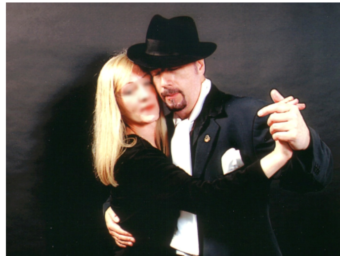
Typisch. Die Milonguero-Haltung im Tango Argentino

In enger Umarmung gefühlvolle Musik in harmonisch bewegten Ausdruck zu verwandeln, das ist die Herausforderung jedes getanzten Tangos. Ein wahrhaft kreativer Akt, zu dem sich Mann und Frau in sensiblen Zusammenspiel vereinigen.